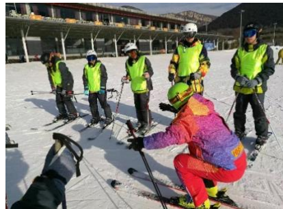
快乐激情的滑雪实训课

本专业培养能够践行社会主义核心价值观，德、智、体、美、劳全面发展，具有较高的科学文化水平，良好的人文素养、职业道德和创新意识，弘扬精益求精的工匠精神，具备较强的就业创业能力和可持续发展的能力，掌握本专业知识和技术技能，面向体育行业的社会体育指导员、冰雪场馆运营与管理、冰雪运动技术教学、冰雪活动策划、冰雪市场营销等职业群，能够从事大众滑雪指导、启蒙滑冰教练、滑雪救援、冰场巡冰、冰雪场馆运营维护、冰雪赛事保障、客服体验服务等工作的复合型技术技能人才。