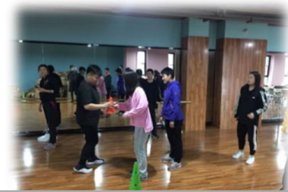
儿童青少年体育游戏创编课程课堂教学