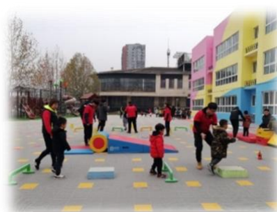
学生在实习实训场地授课