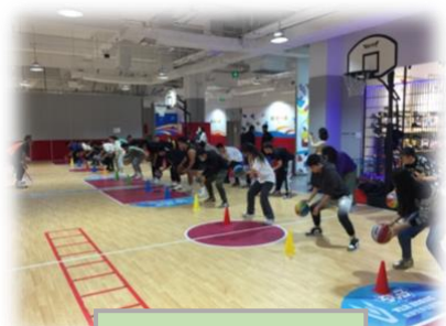
学生体验企业课程

运动课程教练、课程培训导师、客服接待、少儿运动成长顾问、少儿运动培训组织、少儿运动赛事运营、少儿运动市场营销、门店管理、体育网红达人内容创作等岗位工作。