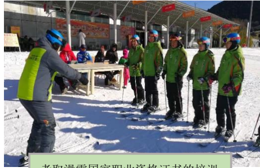
考取滑雪国家职业资格证书的培训

学习期间，本专业学生将完成社会体育指导员、运动防护师、户外指导员等相关职业资格证书课程的学习（取证费用自理）。