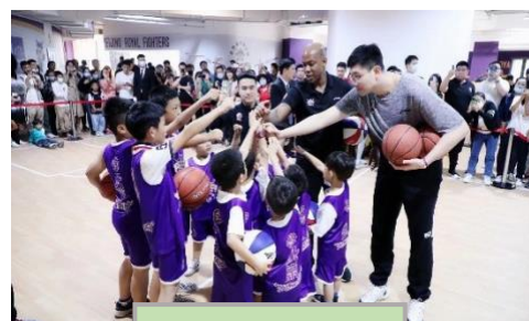
学生参与企业活动