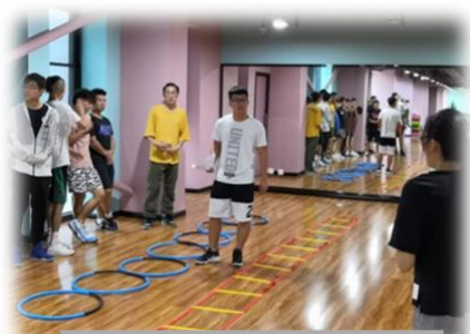
学生完成理实一体课程学习

本专业培养具有良好职业道德和人文素质，全面掌握儿童体智能项目规划与训练、儿童体育教育心理、儿童及青少年体育社会学和体育技术所需要的基本理论、基本技能和基本方法，了解儿童青少年运动场馆运营、教培门店管理等常识，具备从事儿童青少年运动测评、训练、儿童青少年运动项目推广的高素质体育技能型人才。