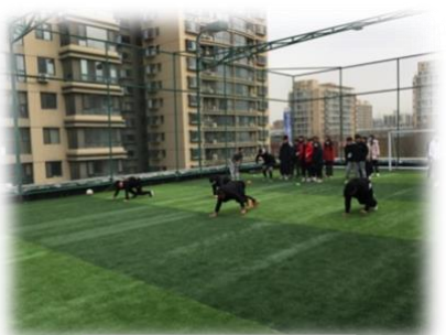
学生体验企业课程